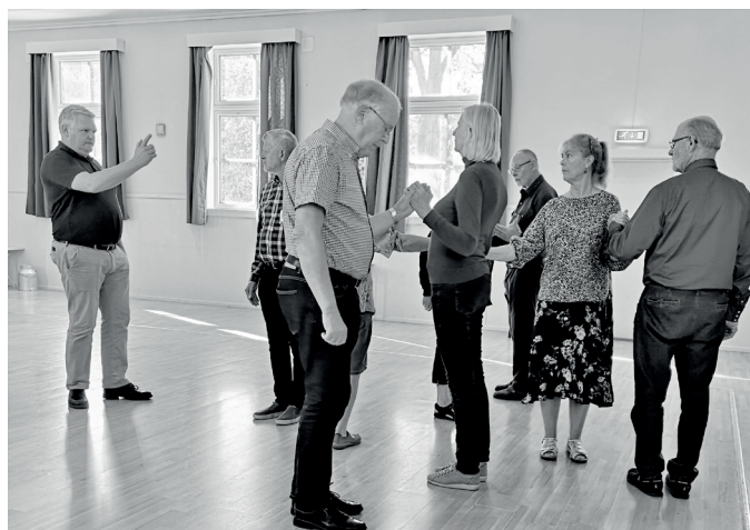
En streng instruktør forklarte hva vi skulle gjøre