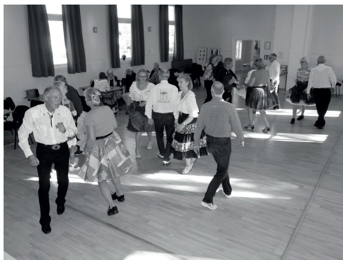
Det var full fart på dansegulvet