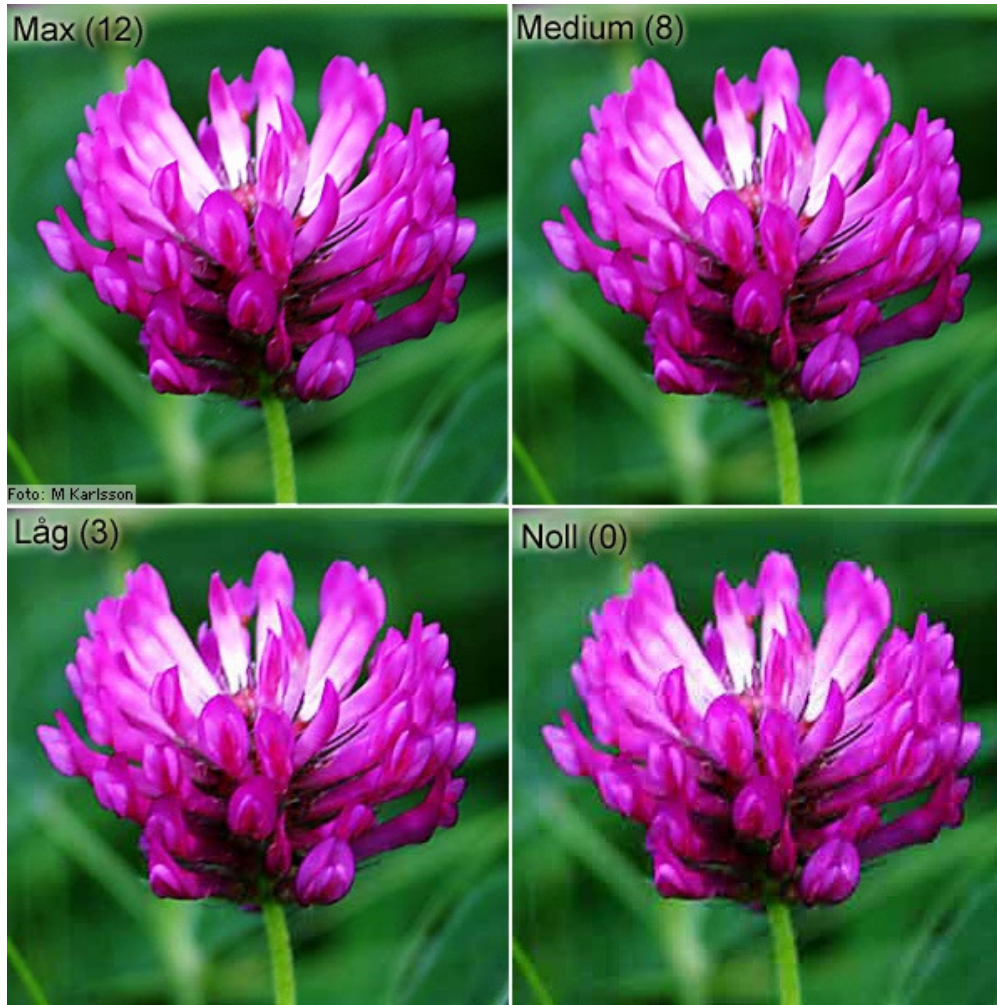
Bild med olika kvalitets nivåer. Ex. i Photoshop.